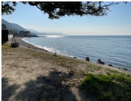
野島平林海水浴場徒歩 3 分