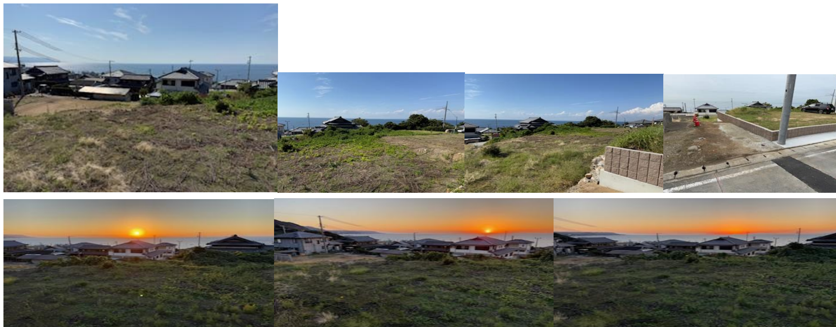
宅地から眺望できる夕陽

淡路 IC 約 10 分 (約 7 キロ) の小高い丘の上にある宅地から幻想的な茜色の夕陽が水平線に溶け込むように沈む景色は安らぎと潤いをもたらしてくれます。徒歩 1～2 分で海が一望できる海際の“クラフトサーカス”では、レストランやバーベキューコーナー、アンティークな商品等が並ぶスペース、地元産の野菜や特産品も販売されています、週末利用や永住にも適した自然環境に恵まれたところです。