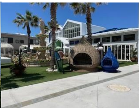
海際にあるクラフトサーカス徒歩 2 分